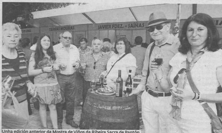
Unha edición anterior da Mostra de Viños da Ribeira Sacra de Pantón